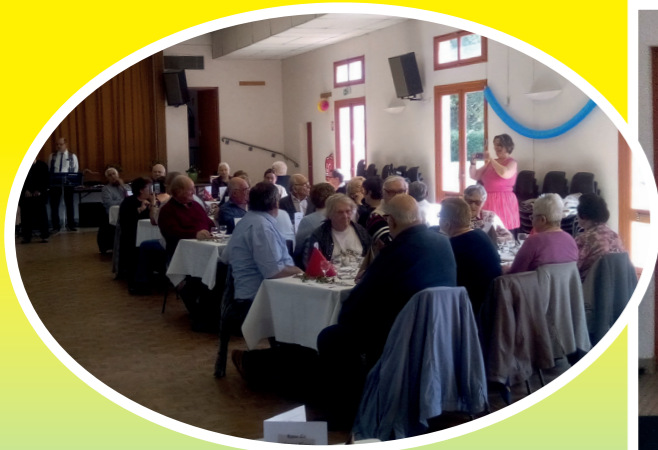
REPAS DES CHEVEUX BLANCS