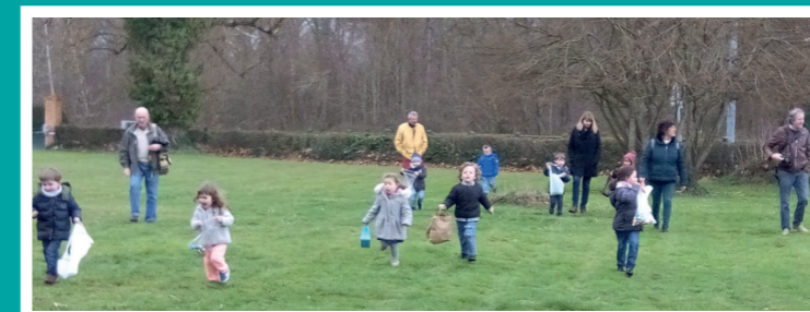
CHASSE AUX OEUFs, WEEK-END DE PÂQUES !