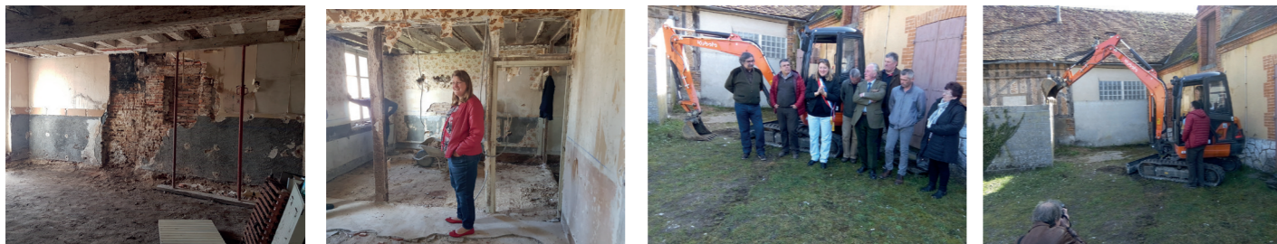
Démarrage des travaux, 1er coup de pelle donné par Mme Le Maire

Les travaux de la Maison Blanche consistant d'une part en sa réhabilitation (tranche ferme) et d'autre part en son extension (tranche optionnelle) en vue du transfert et de l'aménagement de la bibliothèque municipale et à l'avenir d'un cabinet médical sont lancés !