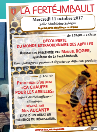
ANIMATION SUR LES ABEILLES