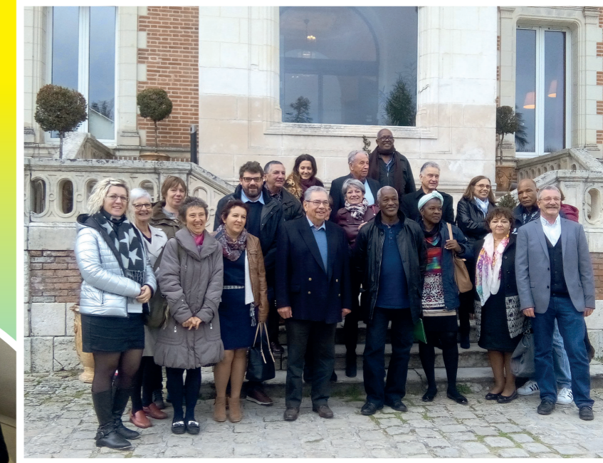
VENUE DE QUATRE MARTINQUAIS DU 24/11/2017