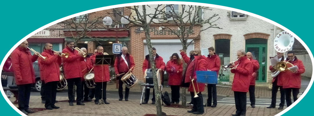
SAINTE CÉCILE 2017