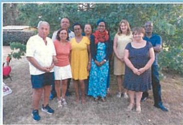
Avril 2019 séjour des Martiniquais recus par le comité de jumelage.

Le jumelage en soit est un lien qui unit, dans un esprit d'égalité et de réciprocité, des populations de deux ou plusieurs pays différents ou même de départements éloignés en vue de créer des liens entre personnes, de favoriser des échanges d'idées.