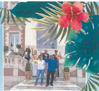
8 août 2019 départ de la délégation Martiniquaise

Seule une longue amitié permet à une ville de compter sur l'autre.