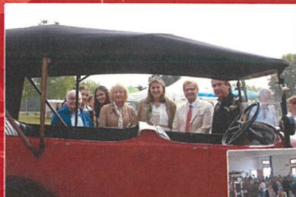
1 er mai Fête du muguet