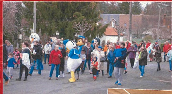
9 mars 2019 Carnaval