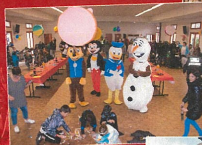
Fêtes de Pâques Chasse aux œufs pour les maternelles au château