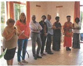
7 août 2019 présentation officielle du serment de jumelage

Il est le texte fondateur du jumelage et exprime la volonté commune des deux villages. Ce texte fait partie des obligations légales et est la base juridique qui permettra à la commune de financer les activités de jumelage.