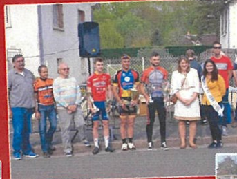
1 er mai Fête du muguet